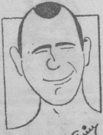
EL VASCO ARNIEGA

La pugna del gran campeón español de los mediano-ligeros, es, en estos momentos una de las más cotizadas en nuestras bolsas pugilísticas. No solo en España triunfa el nombre del excelente pugil, sino que actualmente ha sido requerido por un gran organizador británico en condiciones económicas ventajosísimas. En 1935 fué Campeón de España de aficionados, figurando al año siguiente en una selección boxística española para combatir a Francia, bajo la dirección técnica de Casanovas. En marzo de 1941 ya profesional conquista el título de los ligeros frente al aragonés Pepe Martín. Mas tarde se proclama campeón de los medianos, batiendo al valenciano Llacer. En la actualidad aspira el vacante título europeo de los «welters» (S.O.C.)