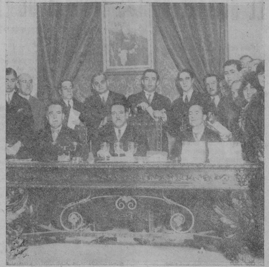
MADRID.—El vicepresidente del Gobierno y el ministro de la Gobernación, general Martínez Anido, en la inauguración del curso de Odontología.