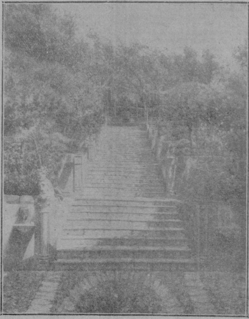
La esca era de Raixa.