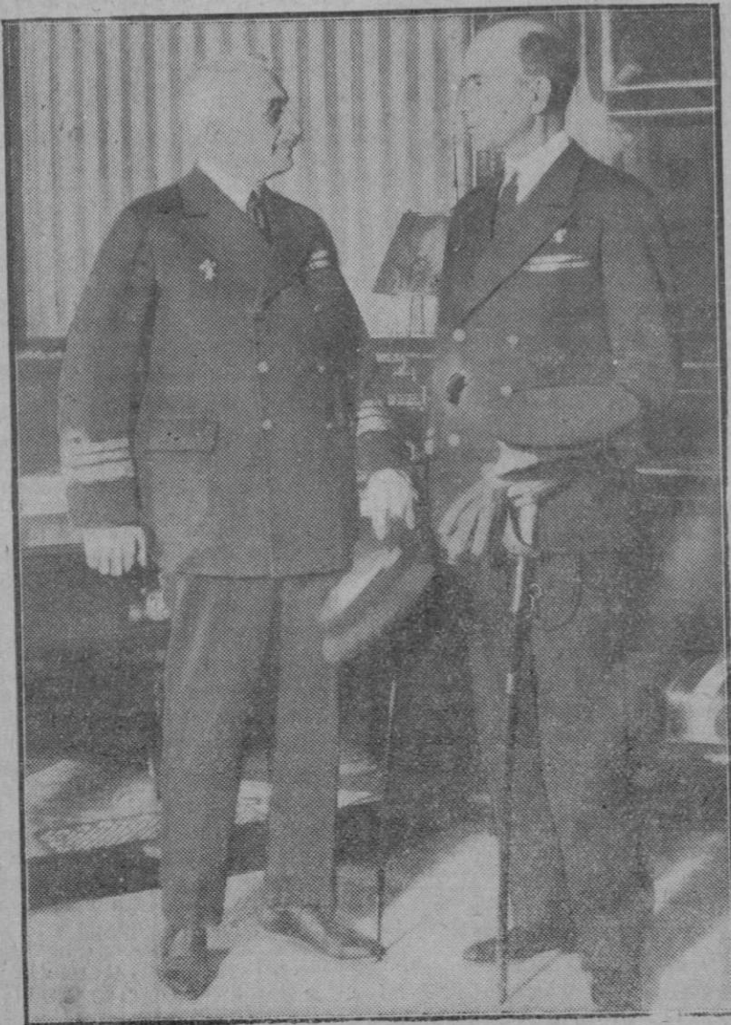
MADRID.—El nuevo Ministro de Marina, contralmirante señor García de los Reyes, que acompaña a S. M. se encuentra en aguas de Baleares, después de a toma de posesión de su cargo, con el Ministro saliente, vicealmirante señor Cornejo, después de celebrado dicho acto

Según el departamento de Trabajo, este año, durante sus ocho primeros meses, el número de turistas que marcharon al extranjero ascendió a 318 mil 419, lo que representa un aumento de 11 por 100 sobre igual período del año 1927.