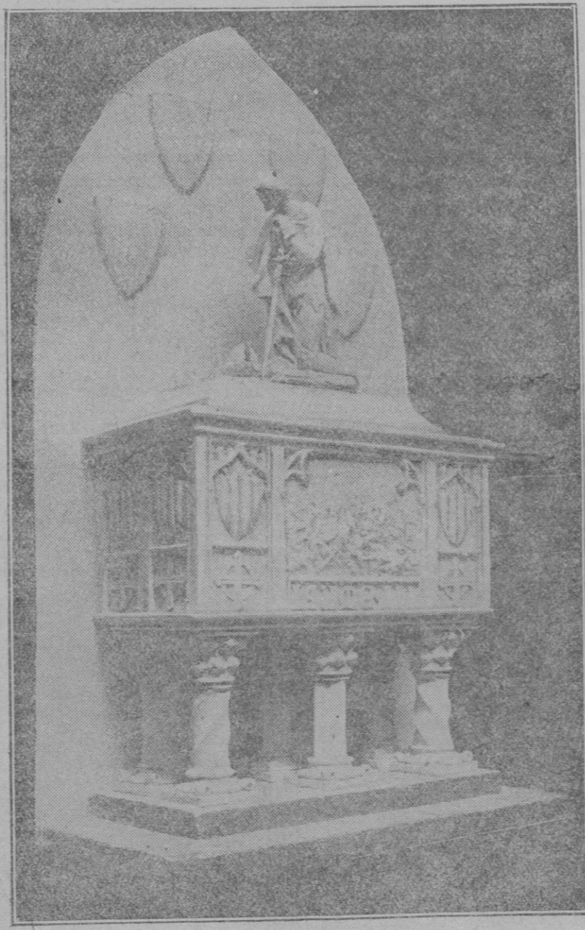
Maquetas de los sepulcros de los Reyes Jaime II y III que serán colocados en la Capilla de la Santísima Trinidad de la Catedral, dibujo del malogrado pintor don Fausto Moral, que serán realizados en piedra de alabastro por el escultor don Tomás Vila.