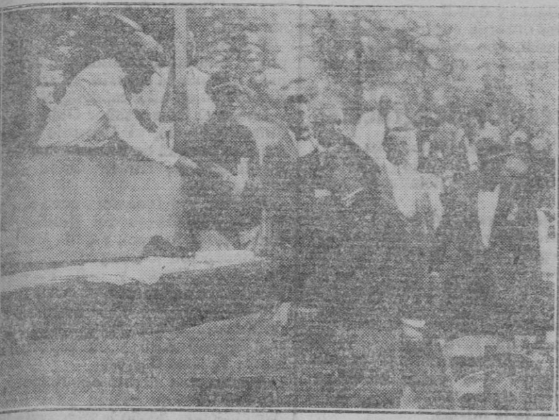
DEL CONCURSO HIPICO.—El Principe de la Milicia española General Weyler felicitando al teniente señor Esparza por haberse adjudicado la Copa del Rey.