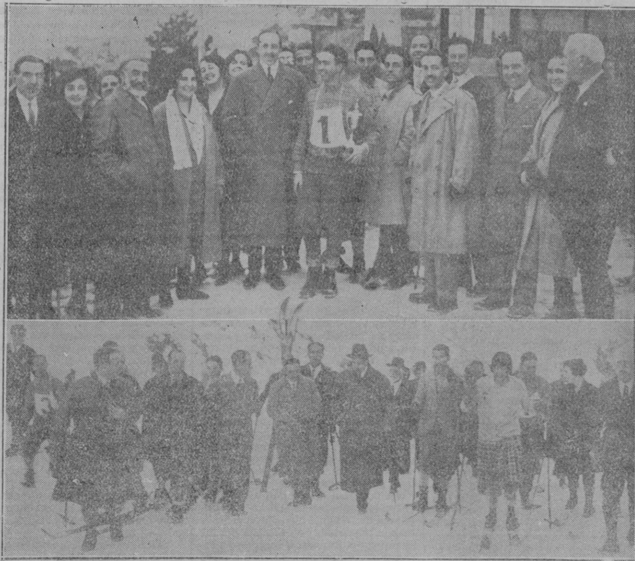
MADRID.—En el Puerto de Navacerrada se ha verificado el concurso de skis para disputarse la copa de Su Majestad el Rey donada a la Real Sociedad Peñalara.

Según Humboldt, los indígenas de la Guayana, para expresar la belleza de una mujer dicen: «Es gorda y tiene la frente estrecha». Un viajero observó que los kirghizes estima-