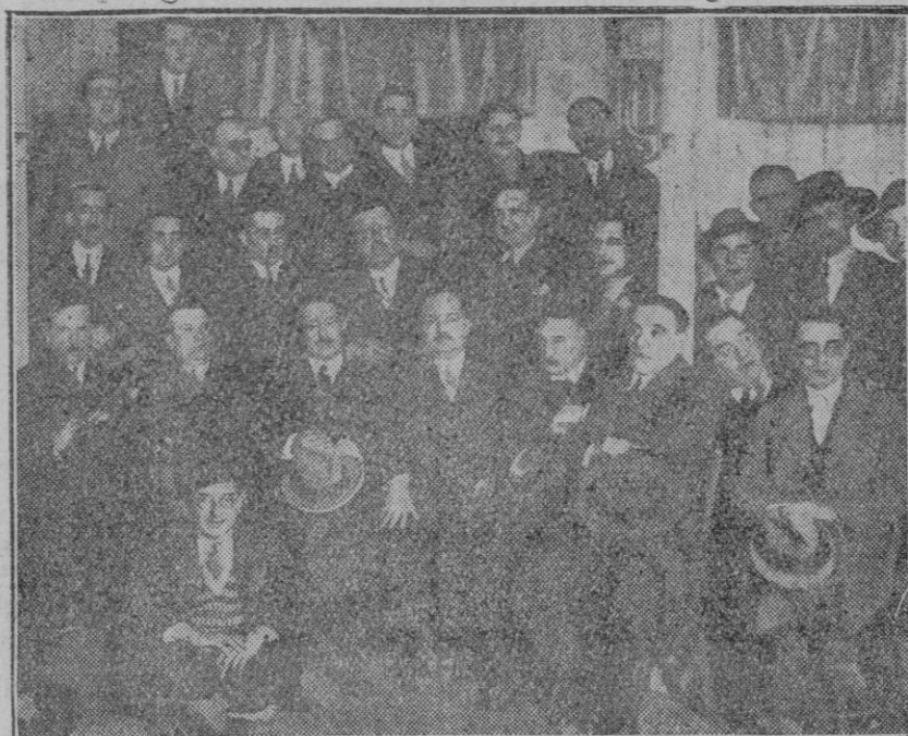
Reunión de periodistas en Córdoba.—Colaboradores y redactores asiduos de la prensa cordobesa que se han reunido para tratar de reorganizar la asociación.