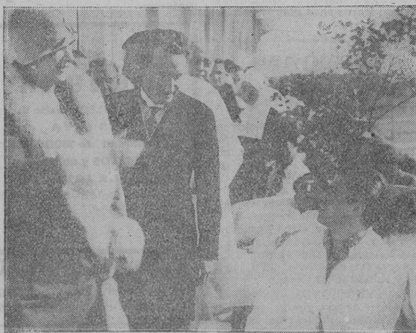
MADRID.—Ha sido inaugurado por Su Majestad la Reina un nuevo pabellón anexo al Hospital del Rey. Asistió el Ministro de la Gobernación y otras personalidades. El pabellón está destinado a tuberculosos.