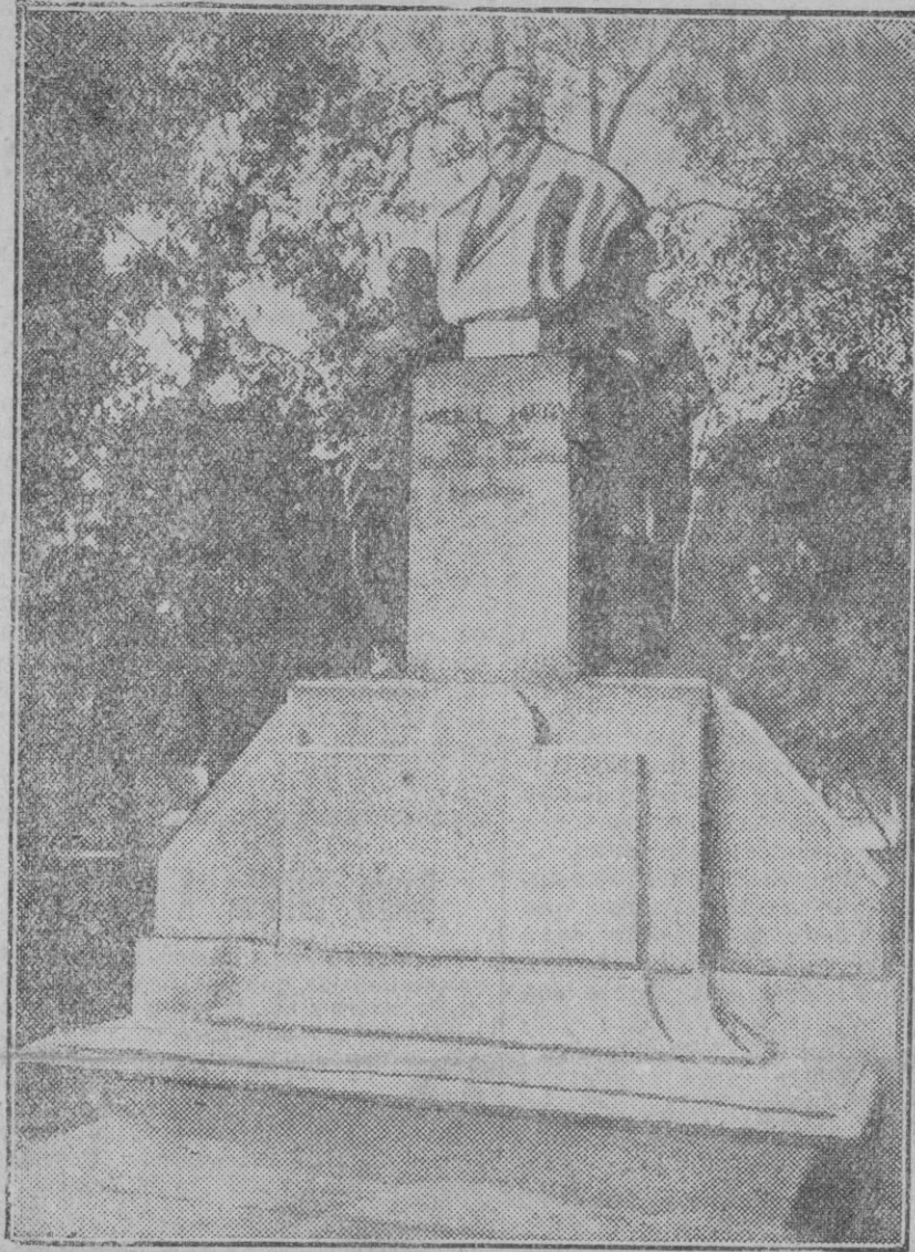
Estatua erigida al que fué maestro de periodistas don Miguel Moya, obra de Benlliure, que se inaugurará en breve en el Retiro.

—No reproche el señor diputado de parcial al presidente de la Cámara. Quéjese de la Providencia que ha establecido esas diferencias entre las condiciones y talentos de los señores diputados.