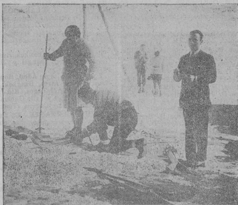
MADRID.—Una pareja de esquiadores en la sierra del Guadarrama, que por la bonanza de la temperatura estuvo concurrenciadísimo, haciendo un alto en su excursión para reparar un esquí de la bella deportista.