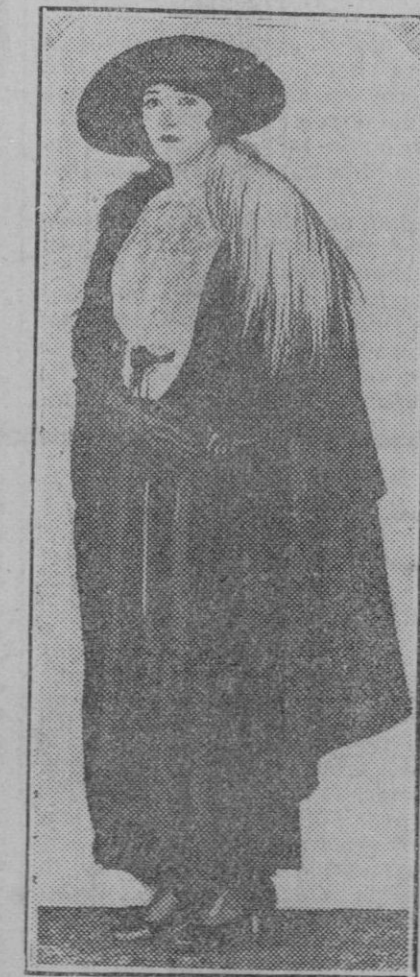
La graciosa estrella de la pantalla Bebe Daniels, que ha sufrido un accidente de automóvil en Nueva York, y que por fortuna no es de gravedad.

El dirigible saldrá de Italia, volará sobre Francia e irá hasta el seródromo de Gatchin, cerca de Leningrado, donde esperará el tiempo favorable para su vuelo a Kings Bay, en Spitzbergen, desde donde se dirigirá al Polo Norte. La expedición seguirá luego hacia Alaska, donde se dará por terminada.