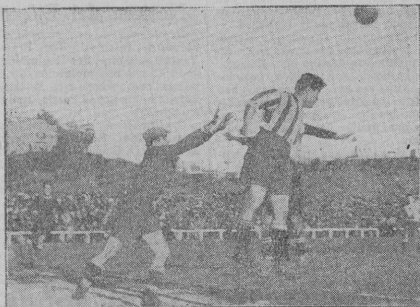
Una oportuna intervención de Moraleja del «Real Madrid», que le valió un goal.