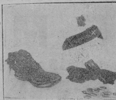
MADRID.—Un trozo de tela (x) con un zapato, monedas y calcetín encontrados que permitieron la identificación. La madre conservaba un fragmento de la citada tela.