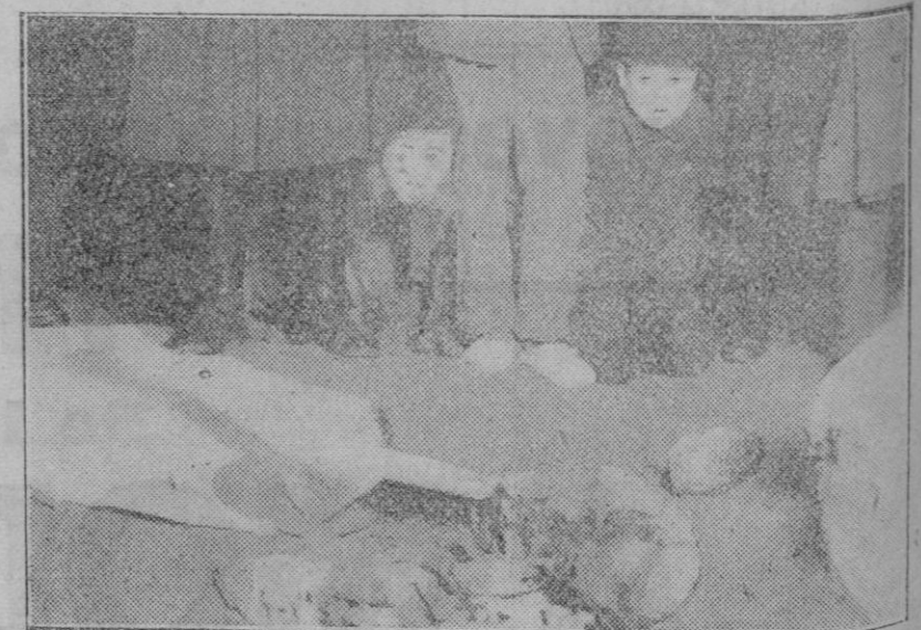
MADRID.—Sitio de la calle de Cea Bermúdez donde fueron hallados los restos de las niñas desaparecidas de la calle de Hilarión Eslava.