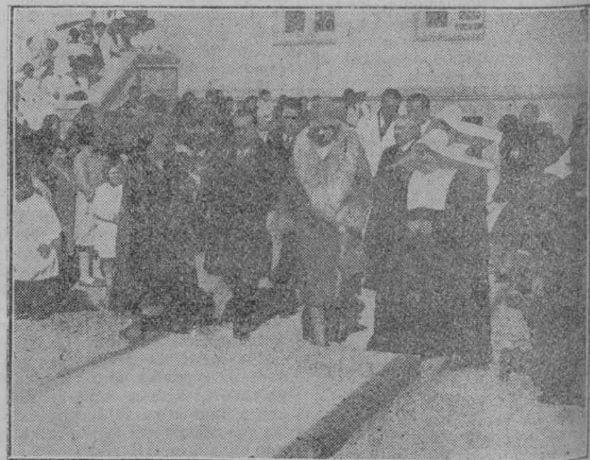
MADRID.—En el Hospital del Rey.—S.M. la Reina con el señor Martínez Anido en la inauguración de un pabellón