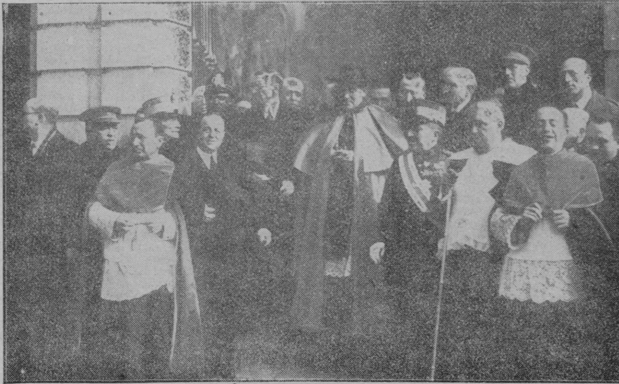
TOLEDO.—El Cardenal Segura saliendo de la Catedral después de haber hecho su entrada solemne en la capital de su Archidiócesis como Primado de España.

Otro de los conferenciantes, Frank Daeson Adams, del Canadá, dijo que en la Edad Media existía la creencia general de que el Océano tenía libre acceso a las entrañas de la tierra a través de huecos situados en el fondo del mar y que el agua salía a la superficie de nuevo a través de ranuras y de poros en las montañas y en los valles, perdiendo la salubridad a medida que se filtraba en su viaje a través de la corteza terrestre.