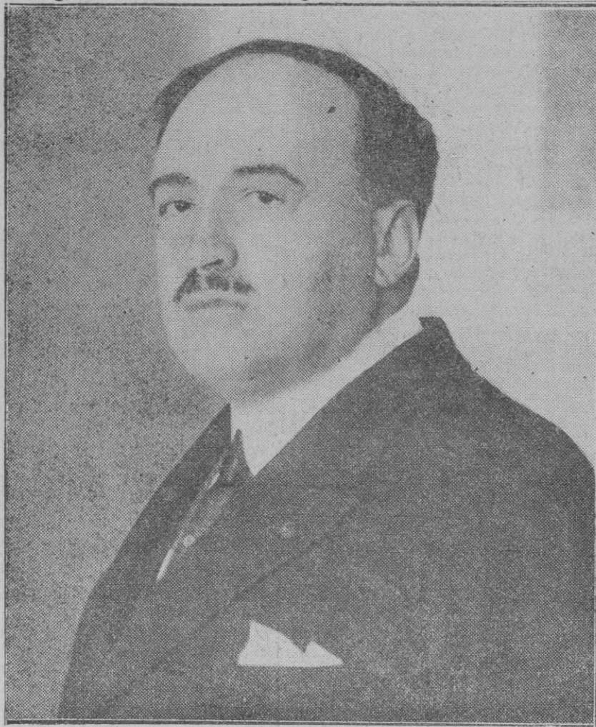
El ilustre novelista Blas Ibáñez que falleció en Fontana Rosa (Menton) en la madrugada del sábado último.

El conocimiento que el geólogo moderno tiene el agua que fluye a la superficie de la tierra, formando ríos, fuentes, etc., demuestra que el líquido elemento que sale al exterior tiene su origen en las lluvias, filtrándose el agua a través de capas delgadas, determinadas por la estructura geológica, y saliendo después por fuentes y manantiales a causa de la impermeabilidad de ciertas capas.