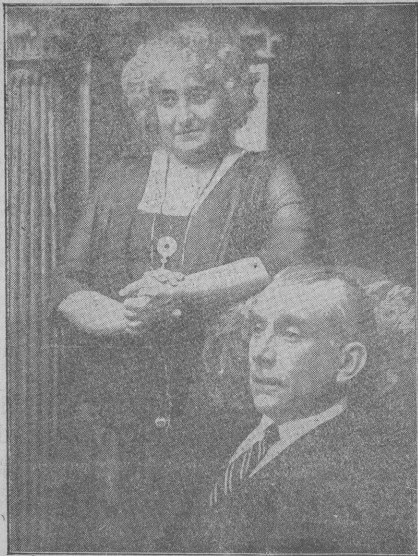
La insigne artista doña María Guerrero que ha fallecido en Madrid. La foto gráfica que publicamos y en la que la ilustre artista aparece acompañada de su esposo don Fernando Díaz de Mendoza, está hecha a raíz de su reciente debut en el teatro Calderón, de Madrid.