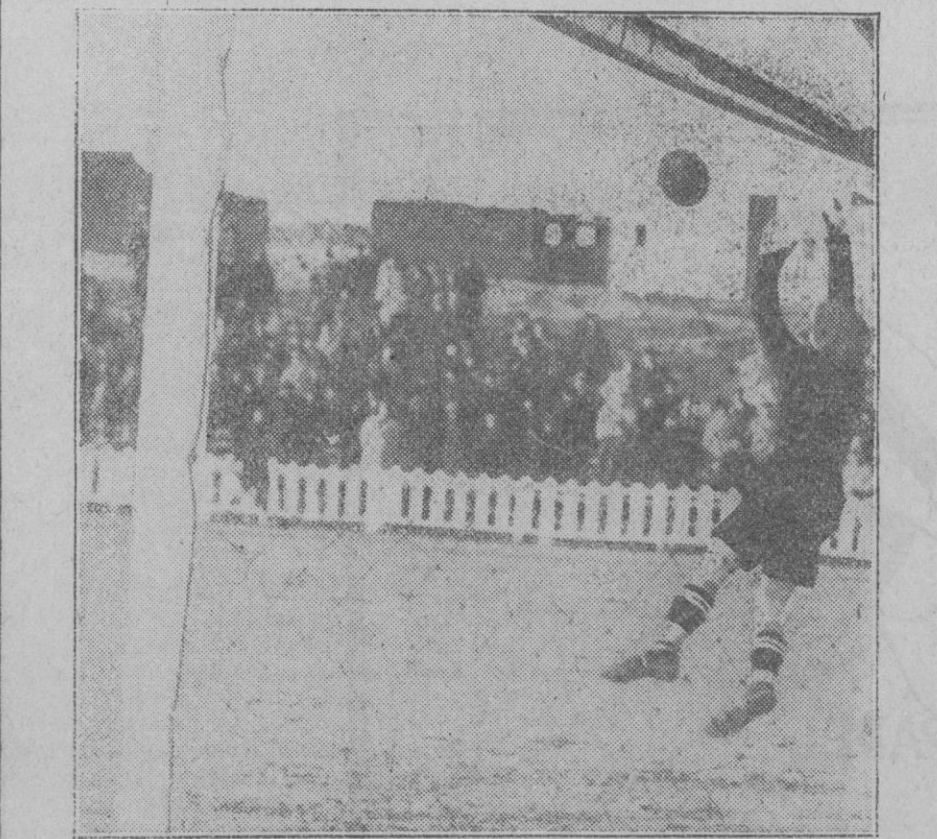
Un momento del encuentro Madrid-Gimnástica

Por de pronto los aficionados pueden volver a confiar en el triunfo de un mallorquín.