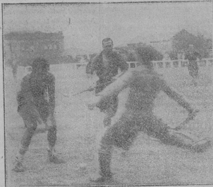
Un momento del partido de «jockey» jugado en la Corte entre los equipos «Ferroviaria» y «Pompín».

visitantes consiguiendo Petro en uno de ellos el segundo goal.