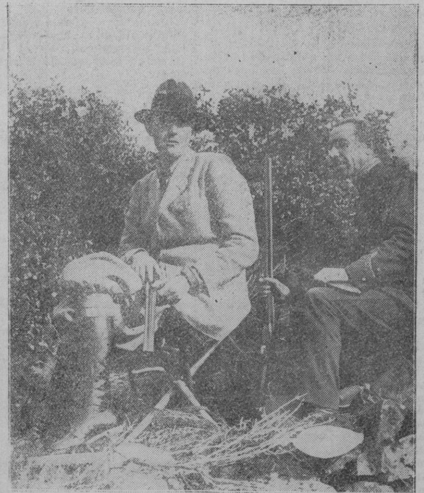
MADRID.—El Príncipe de Asturias durante la cacería que se viene celebrando en Hoyuelos de Manzanares, acompañando a su augusto padre.

Es V. cliente de la Sucursal número 1 de la CASA MATONS.