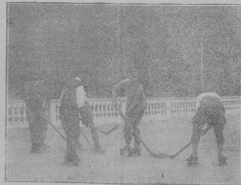
MADRID.—El equipo español que piensa presentarse en la Olimpiada de hockey sobre hielo (en Saint Moritz, se están entrenando sobre patines de ruedas en el skating del Retiro).