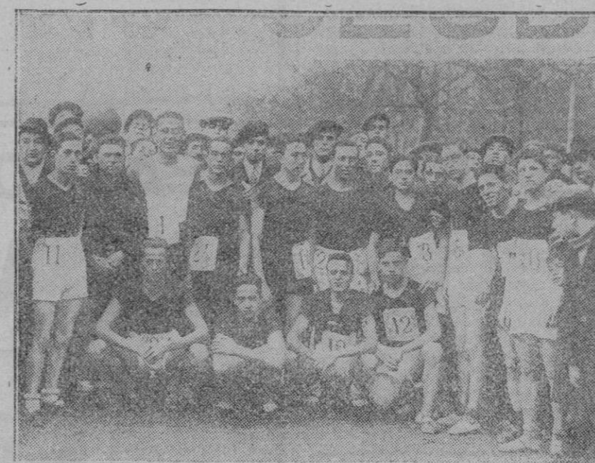
En Madrid se celebró la carrera de «Cos country» organizada por el Racing Club. Grupo de corredores en el Pasco de Rosales.