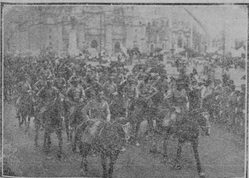
Los soldados mejicanos desfilando por las calles de Méjico.

En una reciente almoneda de sellos raros celebrada en Berlín, se han pagado los precios más exorbitantes