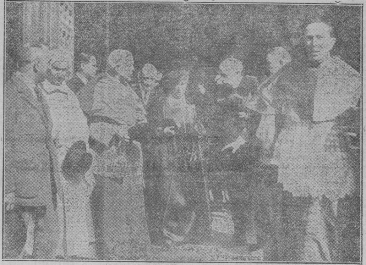
S. A. la Infanta Doña Isabel saliendo de la Catedral de Zaragoza después de asistir a los funerales celebrados en sufragio de los soldados muertos en Marruecos.