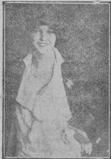
La señorita Ruth Elder, aviadora Norteamericana que emprendió el vuelo de Nueva York a París, cayendo al mar, siendo salvada por un barco holandés.