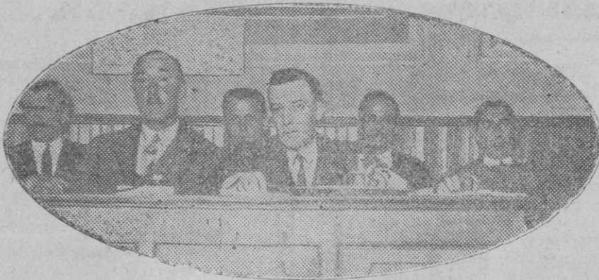
La mesa presidencial de la Asamblea celebrada en Madrid por la Unión General de Trabajadores para definir la actitud de esta organización frente a la Asamblea Nacional.