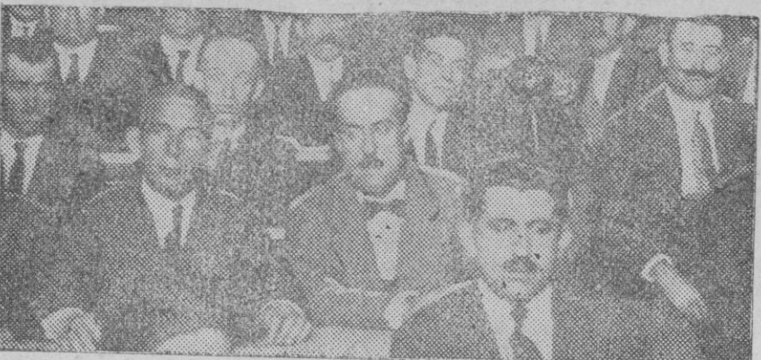
Grupo de asambleístas durante una de las sesiones del Congreso de la Unión General de Trabajadores celebrado en Madrid.