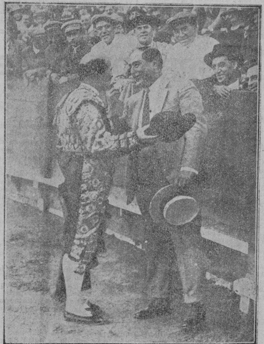
EN LA PLAZA DE TOROS DE SEVILLA

El Gallo brindando un toro al ex-matador Emilio Torres en la corrida en que El Gallo celebraba sus bodas de plata con el toro.