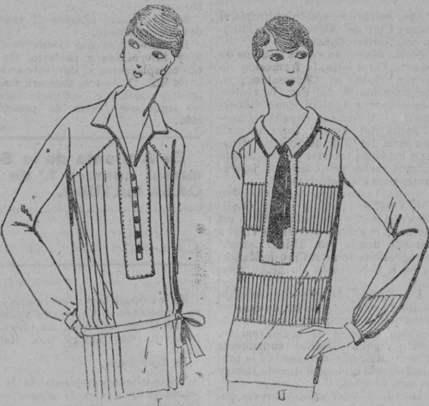
DOS BLUSAS.—1 Camisero de crepé de china blanco, aplique pasando bajo el brazo, pliegues planos muy esbeltos. Metraje: 2 metros 25 de 0'80 de ancho.—2 Esta blusa es de tela de seda de rosa pálido. Bandas de plisados finos son colocadas en través y componen todo su adorno que se repite en los bajos de las mangas. Metraje: 2 metros 50 de 0'80.

las damas de cierta edad se muestran partidarias a la moda de este tul flexible. Blanco y negro, o malva, blanco y granate sobre fondo de ponjé blanco, tales son los tonos actualmente en favor.