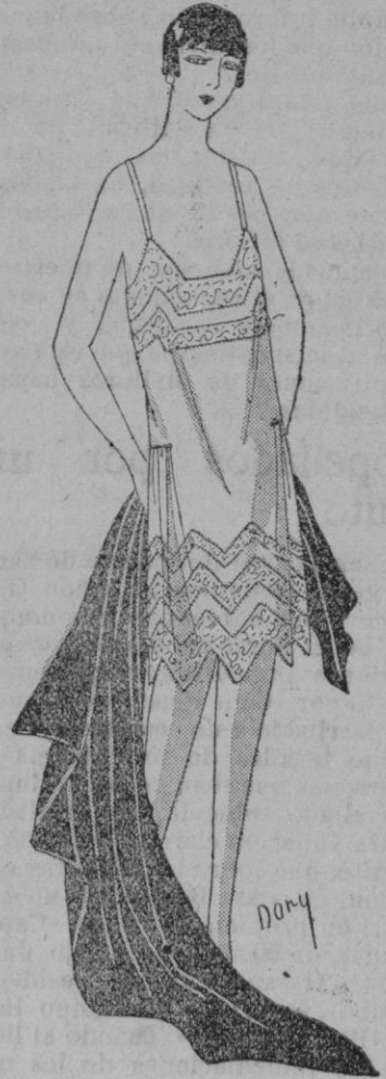
CAMISA-REFAJO.—Presentamos en esta figura la exquisita silueta de una camisa-refajo. Estará bien en crepé de china "limon" incrustada con valenciennes. Se escogerá un encaje de largos dientes puntiagudos a fin de no ser constantemente obligadas a hacer pequeñas cinturas. Se encontrará muy fácilmente este encaje en punto de París.

Las casacas son infinitamente prácticas, hermosos botones de perlas rosas tienen lugar de adorno, cierran el escote y la cintura.