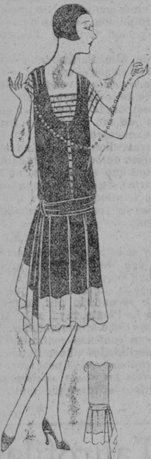
TRAJE.—Traje de crepé de china azul soldado, orlado rosa. Interior del chaleco en geo rosa.