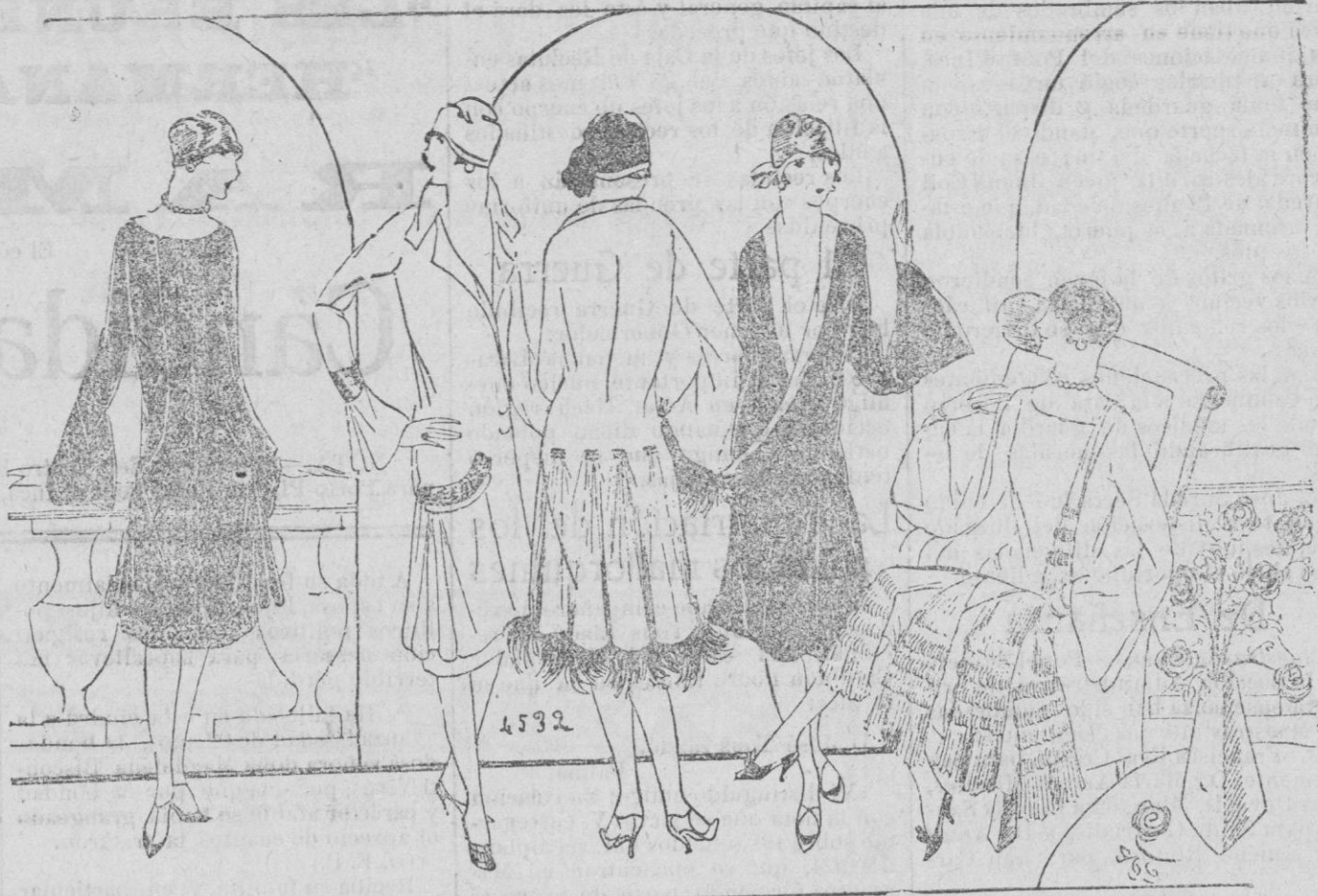
PANORAMA.—He aquí dos hermosos modelos de Berthe Hermanos, uno de crepé de china bordado oro, otro de crepé de china azul pálido con la falda plisada. El abrigo de Madeleine & Madeleine, de fulgurante con mangas anchas y un costado formando godettes. Lo que da amplitud a este hermoso modelo de Madeleine & Madeleine son los godettes colocados en ambos costados. El abrigo de seda madera de rosa es encantador con sus plumas de avestruz de un tono algo más oscuro.

«El pelo corto ha triunfado en toda la línea—declara—. Casi todas las mujeres tienen la cabeza demasiado gruesa con relación al cuerpo y este defecto de estética ha venido a ser remediado por la moda de la melena, que alarga el cuello femenino y disminuye el volumen de la cabeza. Las mujeres de hoy en día parecen más jóvenes de lo que son en realidad y desde este punto de vista no se puede oponer tampoco reparo a la moda. Pero algunas aprovechan la boga actual para exagerar la tendencia y parecerse a muchachos y ello es sensiblemente horrible.»