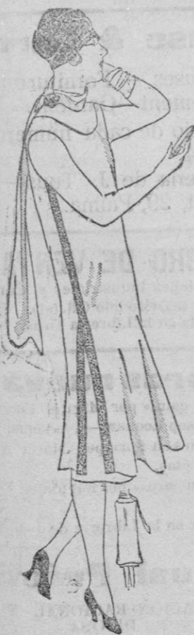
TRAJE.—Traje de una hermosa línea, de crepé de china azul nautier formando túnica o casaca de costado, adornado con un galón de pajaritas rosas.

Pero a título de curiosidad las contestaciones de las personas que gozan de cimentada notoriedad ofrecen cierto interés comparativo. En la encuesta a que nos referimos, uno de los primeros interrogados ha sido Jean Gabriel Domergue, el pintor de moda entre el elemento femenino de París, cuyos retratos de mujeres de la aristocracia francesa y de la buena sociedad de las colonias extranjeras son muy apreciados. Domergue, como no podía menos de esperarse, puesto que todos los modelos que lleva al lienzo llevan melena, se decide por el pelo corto... pero impone un límite a la maquinilla y a las tijeras del peluquero.