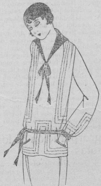
BLUSA.—Blusa de crepé de china blanco adornado con calado. Cuello marino y adornado con satén verde ciprés.

La moda de primavera se caracterizará por una variedad de detalles