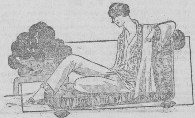
PIJAMA.—Presentamos en esta figura un pijama gracioso. Está bien en la nota nueva con su chaleco engrandeciendo la casaca. El conjunto es de franela blanca, adornado con adornos en el cuello, en las mangas y en el bajo de los pantalones, así como de un anecho chaleco de franela blanca, rebordado con tonos vivos y multicolores.