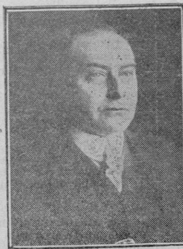
El Doctor Curtius, prestigioso político alemán y probable canciller del Reich.

—Es lo que conseguimos hacer creer a los demás.