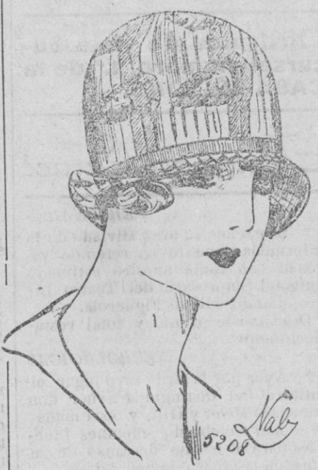
SOMBRERO.—De José, sombrero de cintas rosas de dos tonos, trabajado y formando motivo.