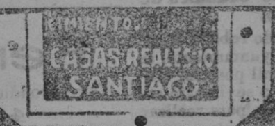
CASAS REALES SANTIAGO