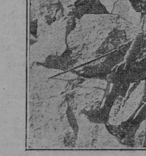
Columna de tanques atravesando el río Guis.—Grupo de moros presentándose a entregarse en las posiciones últimamente conquistadas.