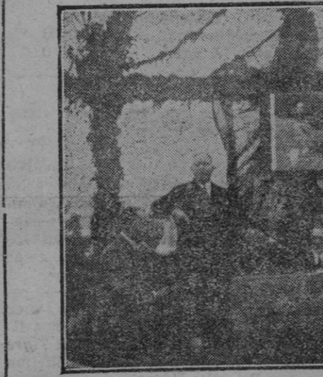
La presidencia del acto en la colocación de la primera piedra de la Escuela de Petra. El Alcalde señor Horrach pronunciando su discurso.