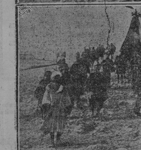
Columna de tanques atravesando el río Guis.—Grupo de moros presentándose a entregarse en las posiciones últimamente conquistadas.