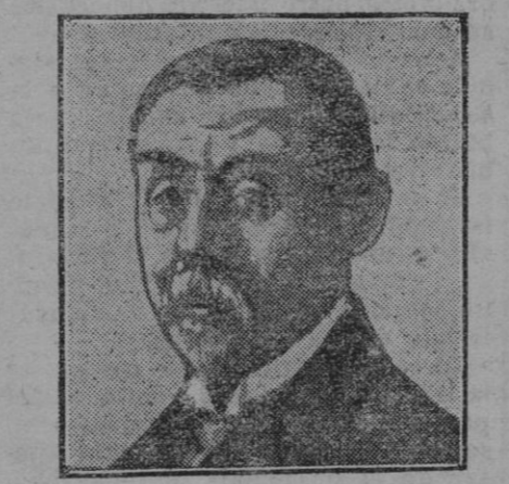
El general Simón que presidió las negociaciones de Uxda y que recibió la primera confidencia de la rendición de Abd-el-Krim.