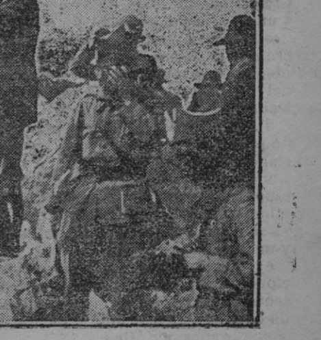
Columna de tanques atravesando el río Guis.—Grupo de moros presentándose a entregarse en las posiciones últimamente conquistadas.