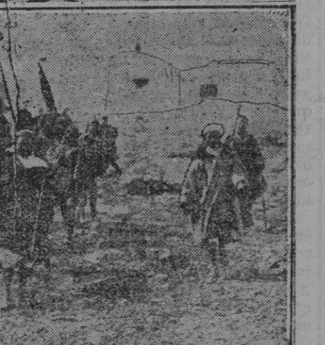
Columna de tanques atravesando el río Guis.—Grupo de moros presentándose a entregarse en las posiciones últimamente conquistadas.