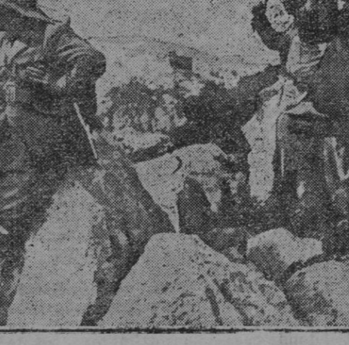
Columna de tanques atravesando el río Guis.—Grupo de moros presentándose a entregarse en las posiciones últimamente conquistadas.