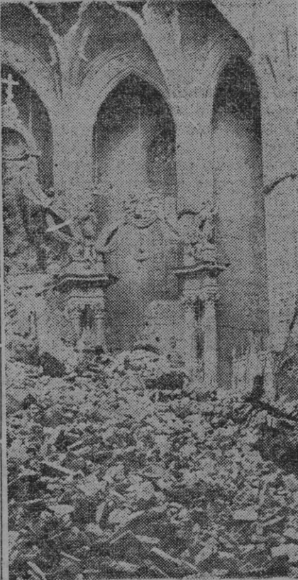
FRANCIA.—Interior de la antigua Iglesia de la Dalbada, de Tolosa, después de la catástrofe ocurrida por el derrumbe del campanario, en la cual resultaron varios muertos y heridos.

cia la amargura de su pobre vida trágica.