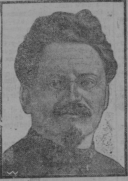
El Presidente de la República de los Soviets, Trotski.

Esto por lo que al interior respecta. Por lo que al Ensenche se refiere, la responsabilidad que con su descuido ha dejado el Ayuntamiento es propor-