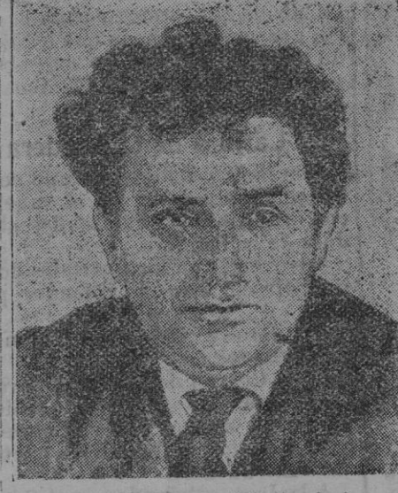
Zinovief, el gran jefe de la internacional roja, a cuyo cargo se halla la propaganda bolchevique.