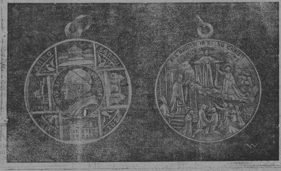
La medalla conmemorativa del actual Año Santo.

Londres.—La cuestión del hambre a consecuencia de las malas cosechas y la falta de combustible ha sido puesto a debate en la Cámara Irlandesa, donde se ha preguntado al gobierno qué pasos dará para aliviar la situación si las declaraciones de los corresponsales especiales de la prensa son verídicas.