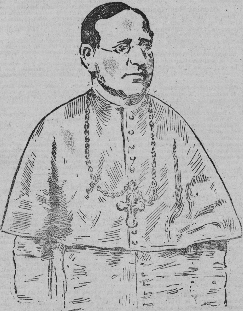
Eminetisimo Cardinal Monseñor Aquiles Ratti, elegido Sumo Pontífice en el Cónclave del 6 de febrero de 1922.