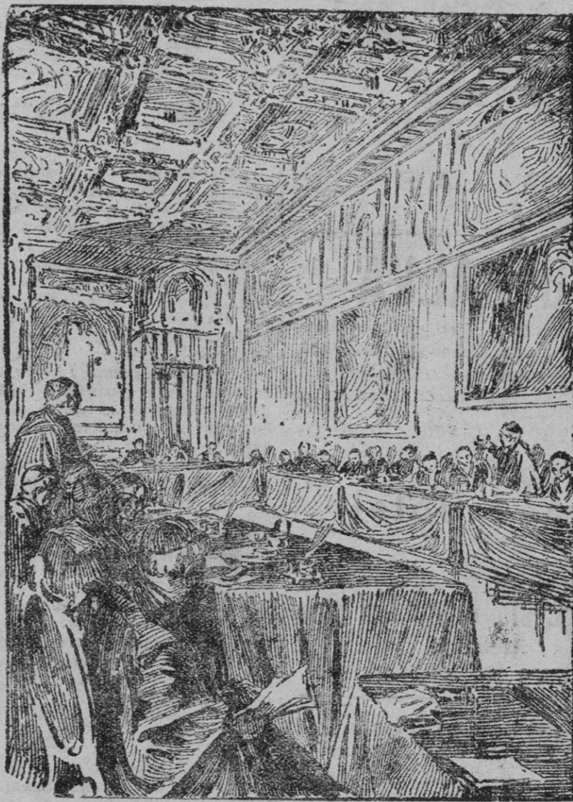
CAPILLA SIXTINA.—Los cardenales reunidos en Conclave para la elección del nuevo Papa.