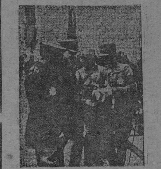
Generales francés, inglés y turco en Salónica

Organizados para el propósito confiado de afrontar las nuevas grandes tareas que los tiempos actuales imponen, 60.000 ingenieros, arquitectos, dibujantes, constructores, químicos, ingenieros electricistas y arquitectos navales, comprendiendo seis