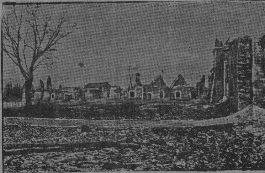
Pueblo de Fresnes, en Woewre