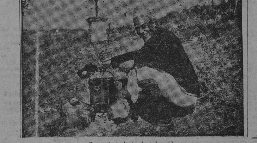
Senegales calentando su comida