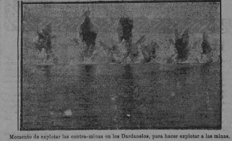
Momento de explotar las contra-minas en los Dardanelos, para hacer explotar a las minas.