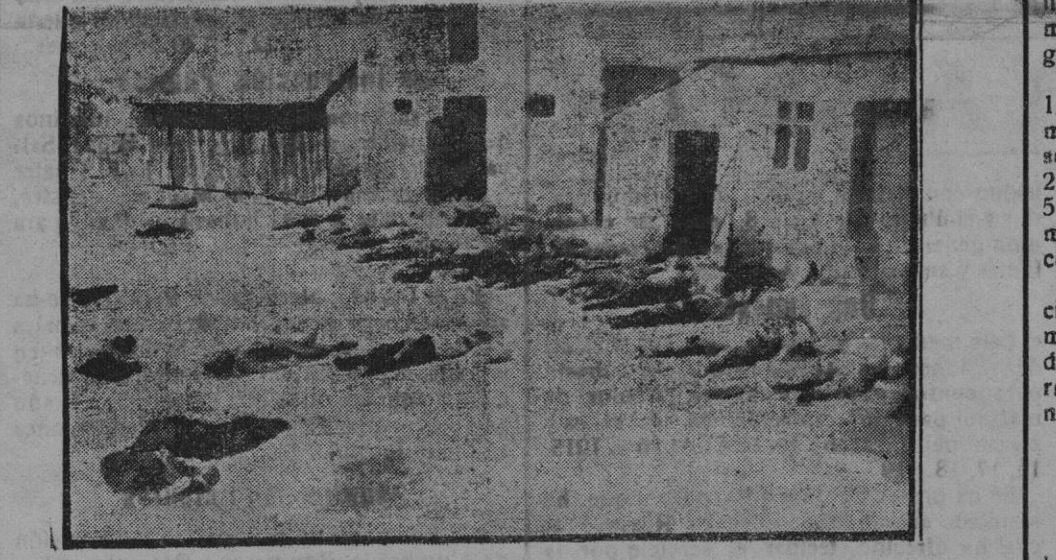
Cadáveres encontrados en una calle de Bélgica después de un combate.