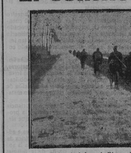
En los alrededores de Dixmunde los soldados van a tomar posiciones.