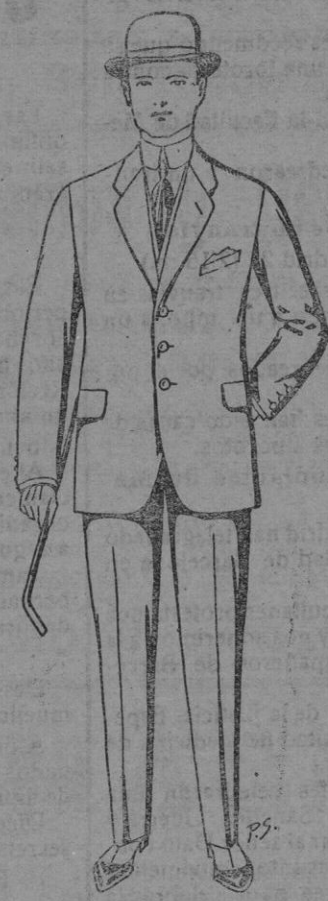
De pts. 17.50 a 70