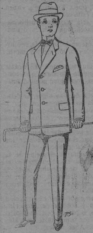
Trajes de paten para jovencitos de 10 a 16 años De pts. 14 a 50