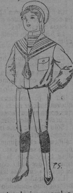
Trajes de jerga azul o negra para niños de 4 a 9 años De pts. 10 a 26