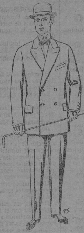
Trajes de paten cheviot, etc. De pts. 25 a 80