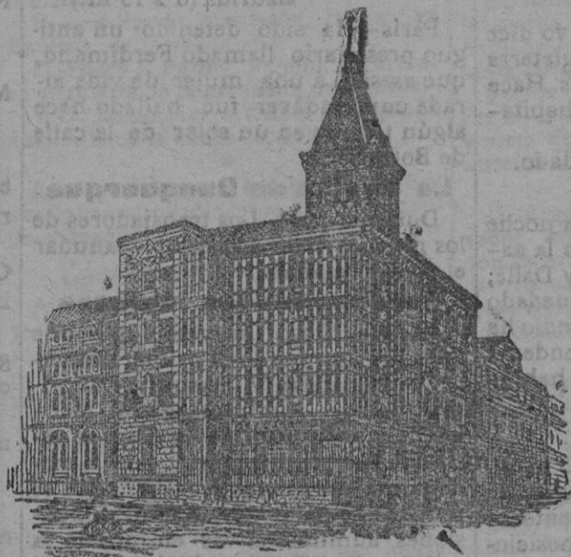
Edificio propio de la Sociedad en Pamplona