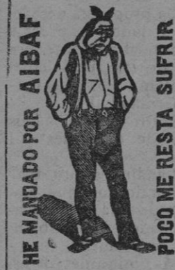
HE MANDADO POR AIBAF POCO ME RESTA SUFRIR

Cada aplicación es un nuevo testimonio de su brillante éxito, destruyendo al propio tiempo la fetidez que la carie comunica al aliento.