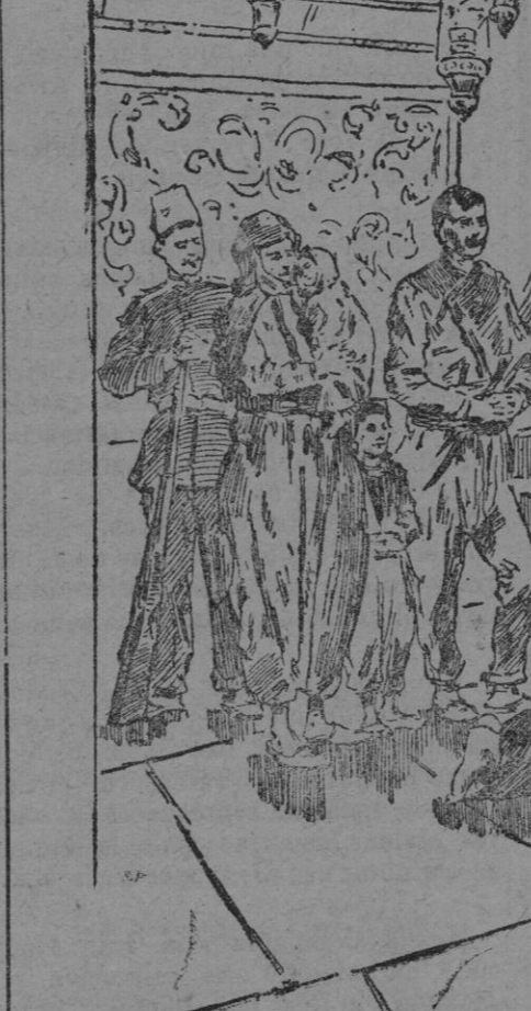
NICHO DE LA NATIVIDAD

Allí los cherks de Belén y los ricos de la ciudad, recibían al consúl y principiaba el besamanos, ¡hermoso espectáculo en verdad, en que las notas brillantes de los uniformes contrastaban con las apagadas y severas de los hábi-