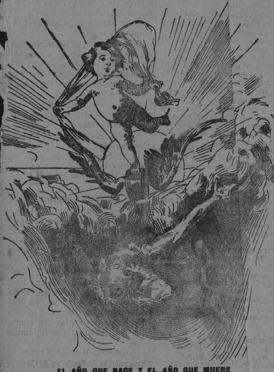
EL AÑO QUE NACE Y EL AÑO QUE MUERE