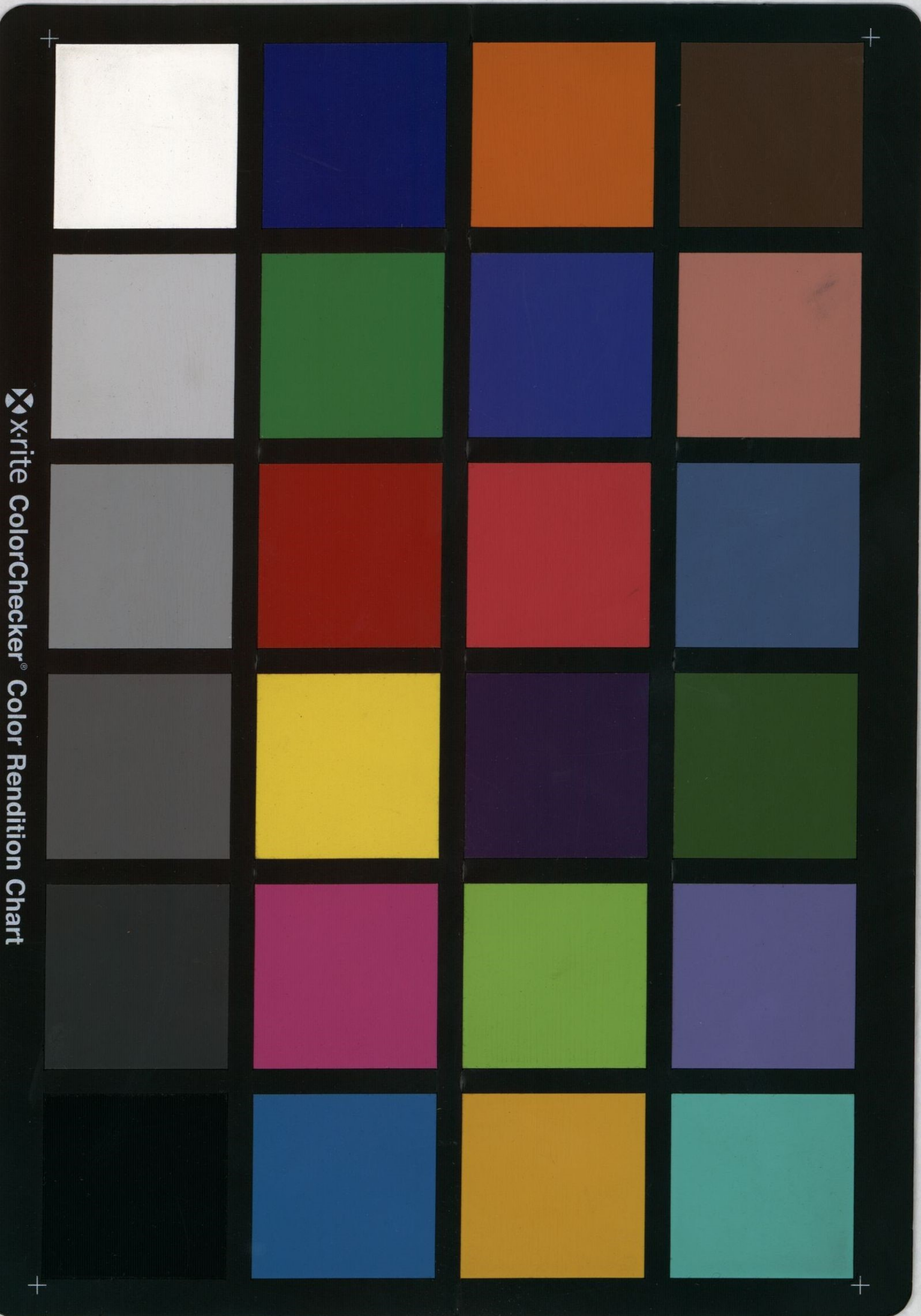
Xrite ColorChecker Color Rendition Chart

Pronto dominó esta ignorancia: que su voluntad de hierro y su clara inteligencia supieron hacer fácil el camino de la cultura. El obrero indolente llegó á descubrir secretos de la industria, perfeccionamientos de la mecánica, refinamientos