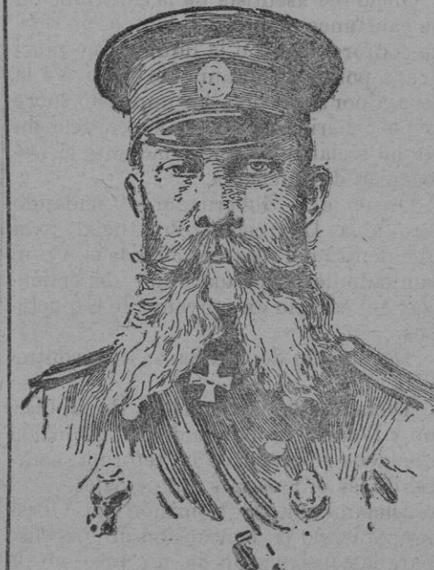
EL GENERAL GRIPPEMBERG Comandante del primer ejército ruso, de cuyo relevo se habla a consecuencia de su derrota en el combate de Sandeputa.

En una ambulancia se lleva, sin mayores trabajos, el aparato descrito, el que puede ser, cuando convenga, llevado a lomo de caballería, ó en barras por dos hombres.