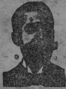
Angelo Costanzi Diputación, 435, ent. Barcelona

El mejor de los medicamentos para la curación de las enfermedades ESTOMAGO.