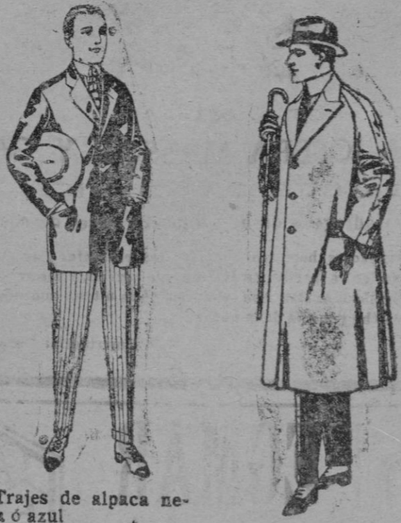
Trajes de alpaca negra ó azul De Ptas. 40 á 85 Americanas de alpaca negra ó azul De ptas. 18 á 40 Pantalones de drill ó franela blanca ó listada De ptas. 6 á 30