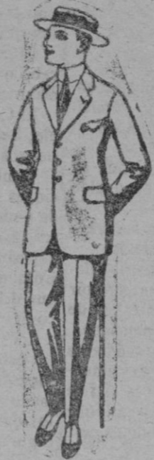
Trajes de lanilla, melton, vicuña, etc., para jóvenes de 10 á 16 años. De ptas. 20 á 55