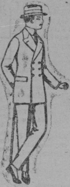
Trajes de lanilla, vicuña ó estambre, para jóvenes de 10 á 16 años. De ptas. 23 á 60