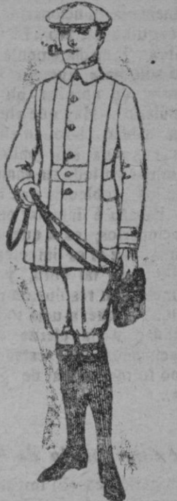
Cazadoras de drill crudo ó kaki. De ptas. 16 á 22 Pantalones cortos de drill beige ó gris, para excursionistas. De ptas. 9 á 15

Ropas confeccionadas para Caballero, Señora, Niño y Niña