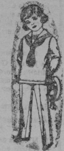
Trajes modelo «Marinera Inglesa», de vicuña ó estambre azul y negro, para niños de 3 á 9 años. De ptas. 26 á 45