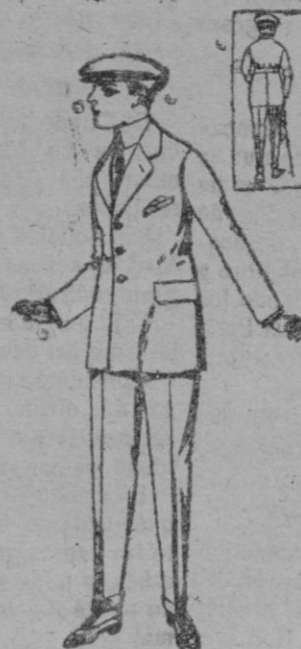
Trajes modelo «Sport», de lanilla, melton, etc., para jóvenes de 10 á 16 años. De ptas. 27 á 60