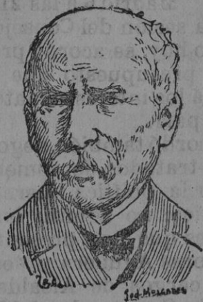
Don Manuel García

El popular centenario español ha muerto ayer en Londres, á la edad de ciento dos años.