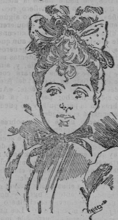
El fondo de esta elegante capota es de paja negra formando pico en la parte de la frente, y se adorna con un gran lazo de cinta de seda del 22, color botón de oro con