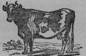
LECHE DE VACA

En el Horno de la calle de Pelaires, n.º 2, la habrá ordeñada á las 6 de la mañana 12 y á las 6 de la tarde.