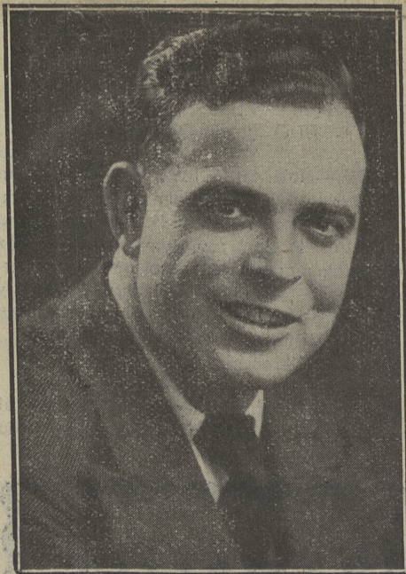
"Poto II", vencedor absoluto del año pasado en la Subida a Navacerrada (sobre "Scott")

El dominio es intenso, los medios blancos anan de cabeza y, sobre todo, Requeiro (P.) no ceta un balón; la delantera athletica se hincha de jugar, pero Quincoces lo despeja todo muy bien, ayudado por Zamora, y muy mal por Quesada que sólo faltas acierta a hacer. Como desde cerca es imposible, Arocha manda un fuerte balonazo desde lejos que entra en la puerta rozando el ángulo superior