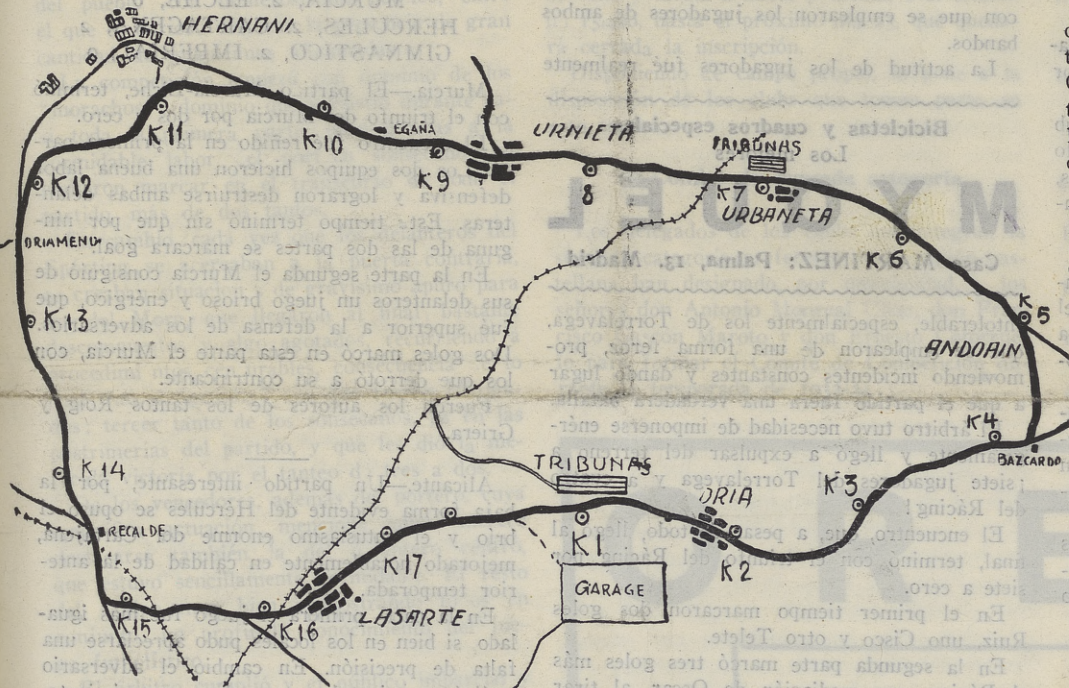
Plano del IX Circuito de Lasarte donde se disputará el Gran Premio de España.