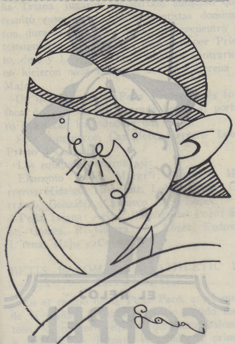
Chiron, vencedor en 1928 y 1929 del Gran Premio de San Sebastián y de España

La lista de participantes con el número de dorsal, es la siguiente: