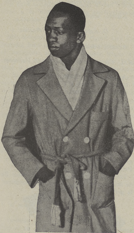
Alf Brown, el campeón mundial del peso gallo que, en un combate revancha, ha batido nuevamente por k. o. al francés Pladner.

La tarde de Chamartín fué poco honrosa para el fútbol madrileño; poco honrosa porque se jugó mal, porque fué de escándalo y