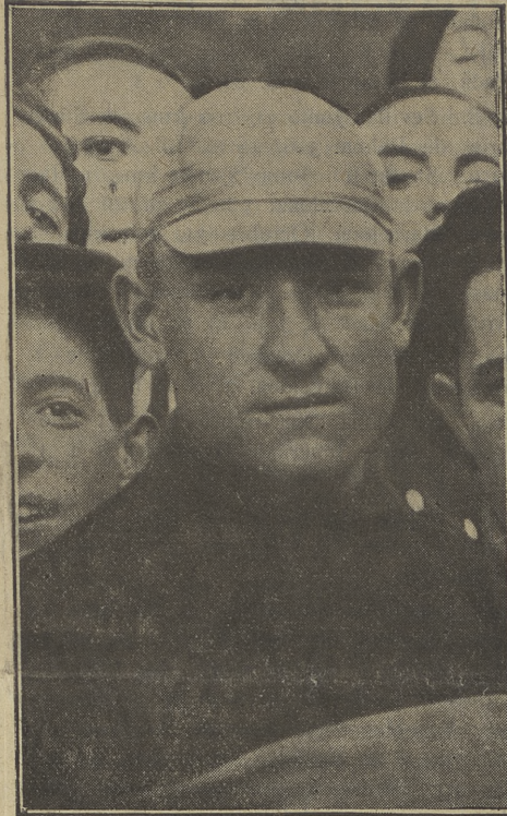
Mariano Cañardó, actual campeón de España y favorito para el de este año

1897. Avila. Abril 11. 100 kms. (con en-