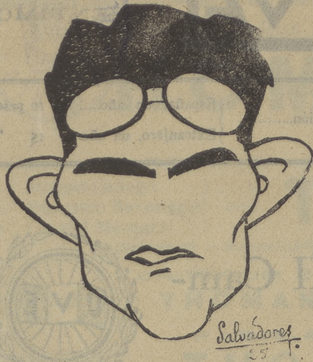
Telmo García, campeón y recordmans de España (100 kms.) en 1926