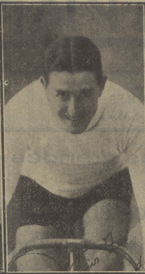
Lázaro Villada, campeón de España en 1917