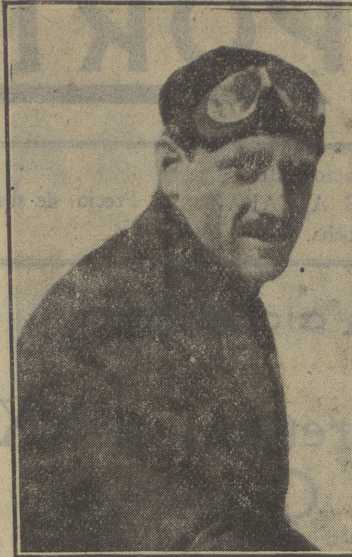
Oscar Leblanc, campeón de España en 1914