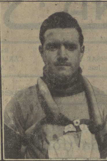
José Manchón, campeón de España en 1916