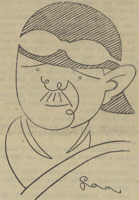
Chirón, vencedor del Gran Premio de Masaryk

Poco después Caracciola chocó, también, contra un árbol, teniendo que abandonar, al igual