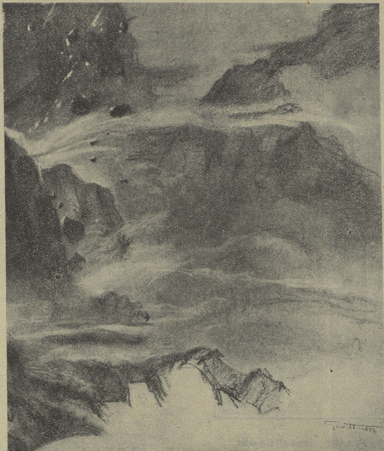
Abrpto paisaje, en el que se hallaron los yacimientos de Silimanita

matérias; los resultados no eran nunca muy felices y la fragilidad de la porcelana, mica, etc., obligó a la industria durante la guerra a buscar un aislante que respondiese a las necesidades de un servicio rudo y constante y de mayor resistencia ante los cambios de temperatura y mayores fuerzas dialécticas.