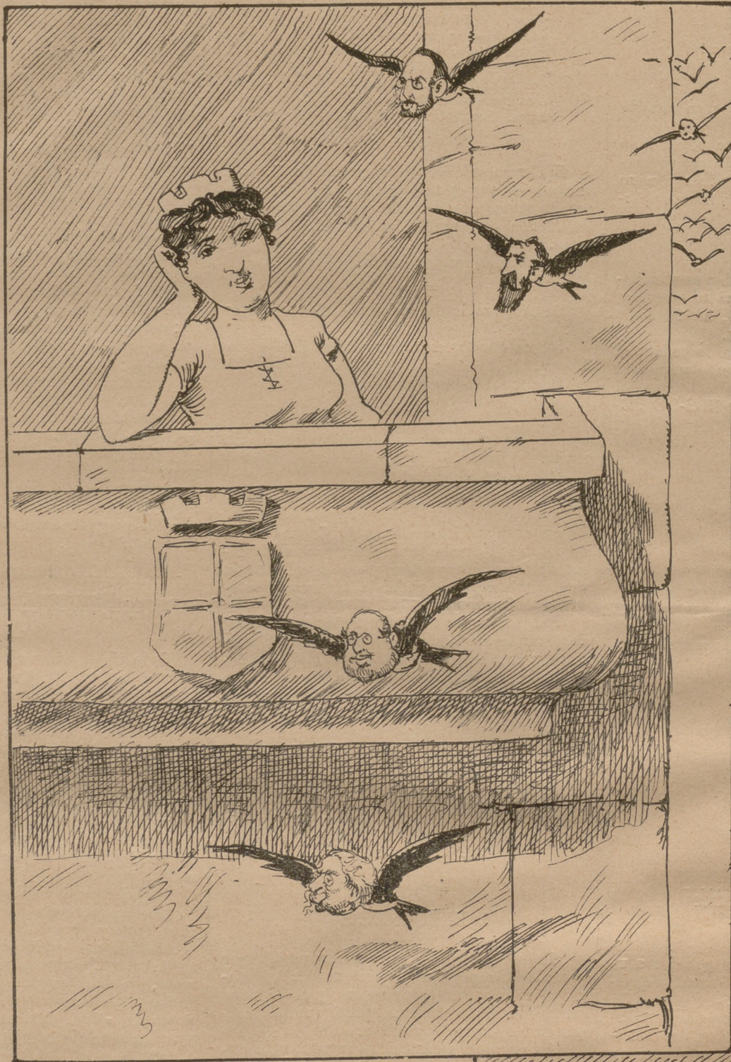
Volverán las oscuras golondrinas de tu balcón sus nidos á colgar,