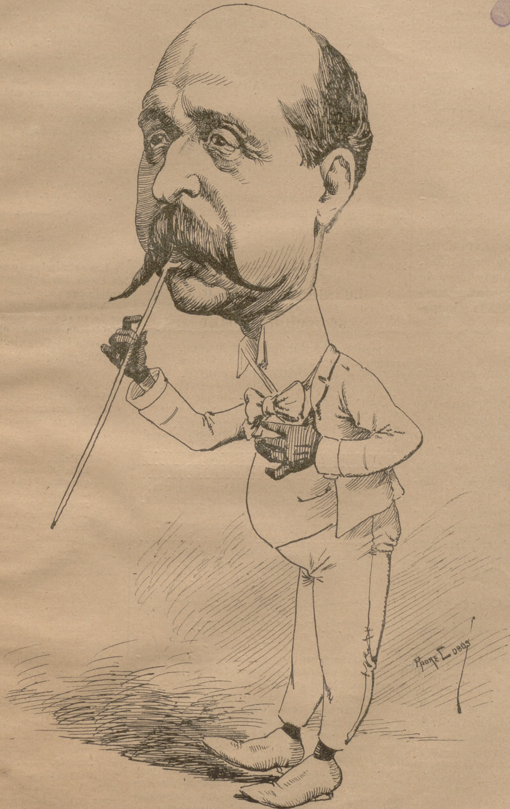
DON SEGISMUNDO MORET