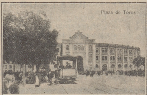
Plaza de Toros