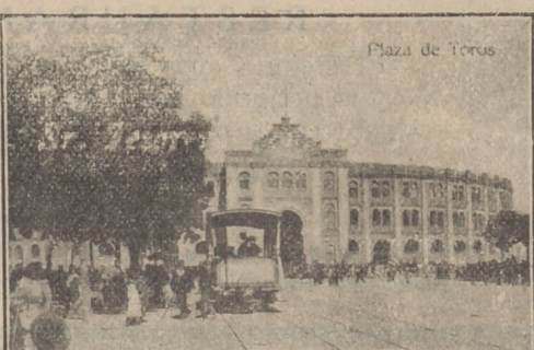
Plaza de toros