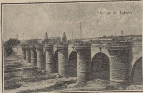
Puente de Toledo