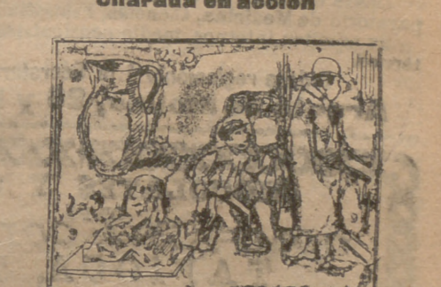
Solución a la charada en acción anterior: Diabólica.