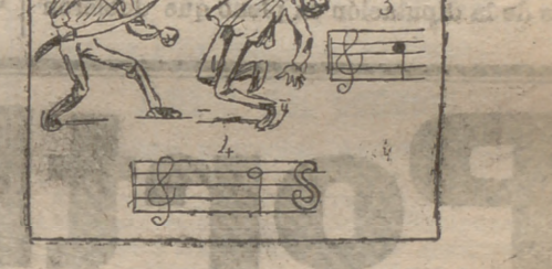
Solución al jeroglífico anterior: En Febrero vale más capa rota que frac nuevo.