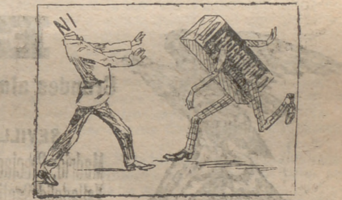
Solución al jeroglífico anterior: En Febrero vale más capa rota que frac nuevo.