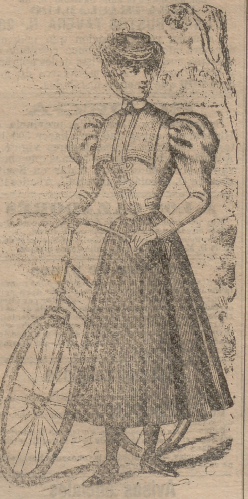
Traje de excursión

La falda es de lanilla color de ceniza y el cuerpo puede hacerse de franela de igual color, ó mejor aun, blanca. Su hechura es de bolero, largo hasta la cintura.